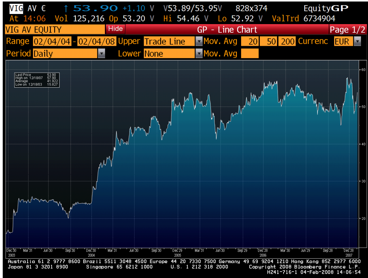
Graf č. 1 vývoj cen Viena Insurance Group v posledních pěti letech

Vývoj cen akcií Viena Insurance Group na burze ve Vídni je zachycen na grafu č.1. Historického maxima bylo dosaženo 4.1.2008, a to 59,09 EUR za akcii. Avšak díky problémům realitního a finančního sektoru v USA došlo k následné korekci cen na současných 50 EUR za akcii. Od roku 2003 posílily akcie společnosti o 108 %, jako defenzivní titul nebyla tato společnost příliš poznamenána turbulencemi na finančních trzích a její vývoj byl poměrně stabilní. V uplynulém roce poklesly ceny akcií o 6 %. Významnou podporou pro akcie společnosti je vždy výplata dividendy s průměrným výnosem okolo 2 %. Do budoucna se očekává pozitivní vývoj cen akcií, a to především díky silnému růstovému potenciálu střední a východní Evropy a významné tržní pozici společnosti v tomto regionu.